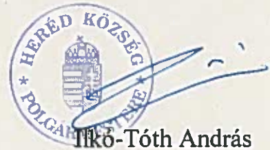
Illkó-Tóth András polgármester